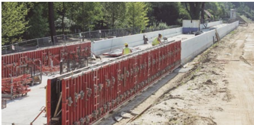
De betonnen onderbaan bij begraafplaats Soestbergen is bijna klaar

ondersteunen de trambestuurder die op zicht rijdt, in het donker en bij slechte weersomstandigheden. Verderop, bij de Koningsweg, krijgt de gelijkvloerse kruising automatische halve overwegbomen. Daarnaast zorgen verbeteringen aan de ligging van de tramsporen ervoor dat rijcomfort en –snelheid toenemen.